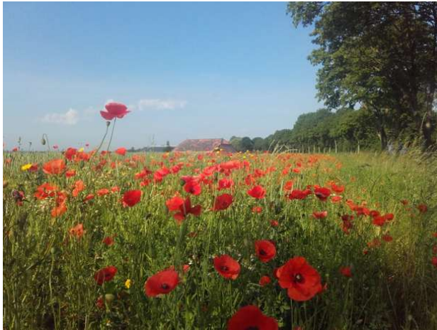
Bloemenblok in de zomer (Reiderwolderpolder)

Bloemenblokken bieden voedsel, veiligheid en voortplantingshabitat. Vogels vinden er veilige broedgelegenheden en voedsel voor kuikens. Patrijzenkuikens en jongen van andere boerenlandvogels eten in de eerste twee weken van hun leven voornamelijk insecten. Dit eiwitrijke voedsel is essentieel voor de groei van kuikens. Daarnaast is er volop zaad te vinden in de herfst en winter én bladgroen aan het einde van de winter als de zaden op raken. Bovendien biedt de begroeiing dekking tegen predatoren en slechte weersomstandigheden. Naast patrijzen zijn er nog vele andere vogelsoorten die van een bloemenblok kunnen profiteren. Ook vlinders, bijen en hommels profiteren van het grote aanbod van bloemen.