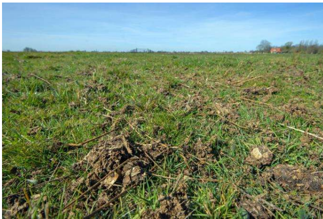
Ruige mest (foto https://www.livinglabfryslan.frl/ruge-dong-oftewel-ruige-mest/ )

Op de wettelijke verplichte bufferstroken mag dit pakket niet!