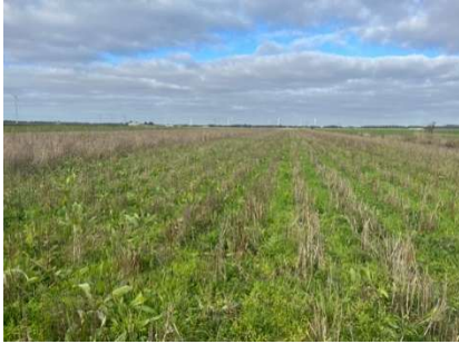
Kruidenrijke akkerrand in Zuidwending en Pekela

In akkerranden wordt geen gewas geteeld. Ze zijn ingezaaid met een mengsel van grassen, kruiden en granen. Ze worden niet bemest en niet bespoten (uitgezonderd pleksgewijs). Akkerranden brengen het mozaïekpatroon terug in het cultuurlandschap en zijn positief voor akkervogels. Vanwege de geringere bodemverstoring en de grotere bufferwerking boeken brede, meerjarige akkerranden meer natuурresultaat dan smalle, eenjarige randen.