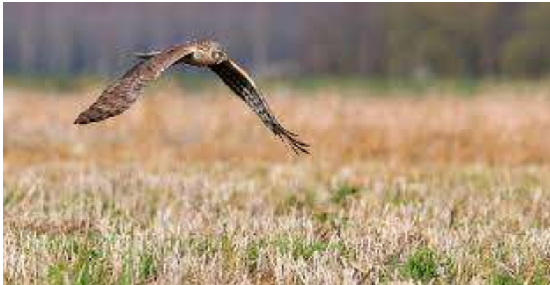
Graanstoppel met Blauwe Kiekendief

Stoppel, met name hoge stoppel, is waardevol voor akkervogels, zeker in combinatie met andere vormen van akkervogelbeheer in de omgeving. Akkervogels vinden hierin dekking én voedsel in de winter. Als stoppel of gewasresten door de winter ongestoord kan blijven liggen is dat heel aantrekkelijk voor zaadeters als veldleeuwerik, patrijs, geelgors en kneu, maar ook voor muizeneters als torenvalk, blauwe kiekendief en uilen. Een graanstoppel die tot en met het volgende groeiseizoen blijft liggen, biedt daar bovenop opgroei en foerageergelegenheid voor akkervogels.