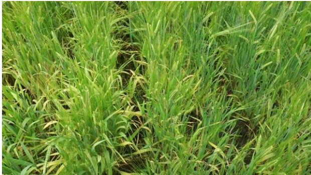
Vogelgraan in Westerwolde

In dit beheerpakket wordt graanteelt aangepast aan vogels in het gebied. Dat betekent dan er dunner wordt gezaaid en dat grondbewerking en gebruik van chemie wordt beperkt. Een combinatie met stoppel zorgt vervolgens voor dekking gedurende het hele jaar. Het gewas wordt wel geoogst.