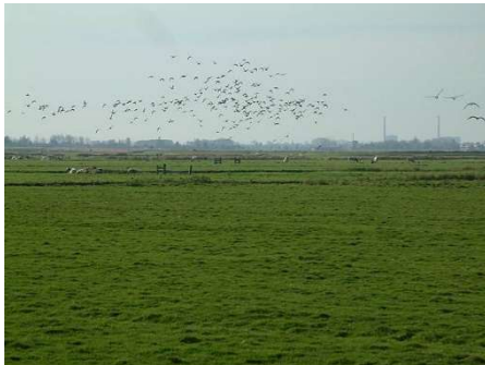
Weidevogellandschap ( https://nl.wikipedia.org/wiki/Weidevogel )

Combineren met hoog waterpeil is een hele waardevolle optie voor grasland met rustperiode. Hoog water remt de grasgroei, waardoor de grasmat geschikt is voor weidevogelkuikens én wormen en andere bodemdieren zitten ondieper in de bodem waardoor ze beter beschikbaar zijn voor weidevogels. Om te voorkomen dat het gras te zwaar wordt aan het einde van de rustperiode wordt afgeraden om vooraf te bemesten. Dat voorkomt dat het gras aan het eind van de rustperiode gaat liggen en vervilt.