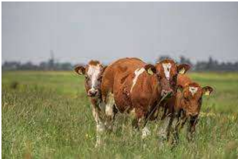
Beweiding met koeien levert meer variatie in structuur dan beweiding met schapen

Dit pakket werkt het best met een veebezetting van 1,5 GVE/ha. Beweiden met 3 GVE/ha is in samenhang binnen het weidevogelmozaïek waardevol. Dit geldt met name als er beweid wordt in plaats van gemaaid in de randzones van een mozaïek. Er wordt gewerkt met een lage veebezetting, zodat er voldoende ruimte voor weidevogels is. Dit pakket past bij een grasproductie van ca. 7 ton droge stof/hectare/jaar. De pakketvarianten onderscheiden zich door de periode van extensief beweiden en de veebezetting.