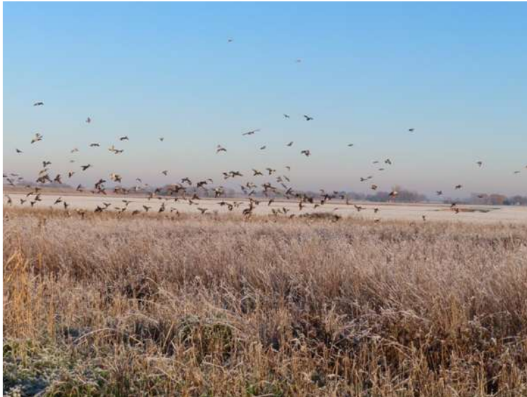
Wintervoedselakker in Reiderwolderpolder

Een wintervoedselveldje is een perceel of strook waar granen en andere zaaddragende planten (bijvoorbeeld bladrammenas) niet worden geoogst of ondergeploegd, maar tot ver in de winter blijven staan. Ze vormen in de herfst en winter een rijke voedselbron voor vogels en bieden dekking. Belangrijk is dat er op tijd gezaaid wordt, zodat de planten tot zaadzetting komen. Vogels komen in grote aantallen op deze wintervoedselveldjes af. Niet alleen zaadetende soorten (zoals de patrijs, geelgors, vink, kneu, keep, groenling), maar ook roofvogels (zoals torenvalk, buizerd, blauwe kiekendief, ransuil, velduil) die hier muizen en zangvogels vangen.