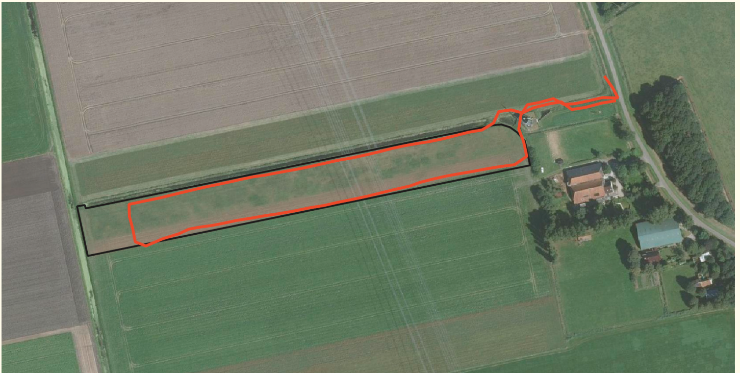
Voorbeeld van de wijze waarop een wintervoedselakker wordt doorkruist (rode lijn)