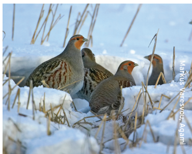
Markus Vreeswijk, Aganti